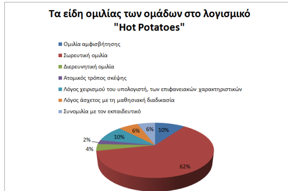
Σχήμα 1: Τα είδη ομιλίας που αναπτύσσουν οι ομάδες κατά την ενασχόλησή τους με το λογισμικό «Hot Potatoes»

Γενικά, μπορούμε να συμπεράνουμε ότι υπήρχε συνεχής διάλογος ανάμεσα στα μέλη των ομάδων με ερωτήσεις που στόχευαν στην εύρεση της λύσης-απάντησης. Ωστόσο, ως προς το γλωσσικό - ποιοτικό επίπεδο της συζήτησης, παρατηρούμε ότι οι ερωτήσεις που τίθεντο ήταν κυρίως κλειστού τύπου και οι απαντήσεις συχνά δεν υπέρβαιναν τη μία λέξη.