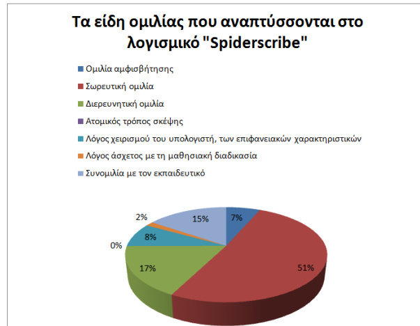
Σχήμα 2: Τα είδη ομιλίας που αναπτύσσουν οι ομάδες κατά την ενασχόλησή τους με το λογισμικό «Spiderscribe»

Με τη χρήση του « Stop Motion Animation » οι μαθητές είχαν την ευκαιρία να δημιουργήσουν τη δική τους ψηφιακή αφήγηση με τη μορφή «animation». Αφού έφτιαξαν με πλαστελίνη τη μορφή της Πινέζας, τραβώντας παράλληλα με την κίνηση του αντικειμένου φωτογραφίες δημιούργησαν μία σύντομη ιστορία κινήσεων της Πινέζας, την οποία είχαν τη δυνατότητα να αποθηκεύσουν στον υπολογιστή με τη μορφή βίντεο και να προβάλουν αργότερα στις υπόλοιπες δύο ομάδες. Σύμφωνα με τα δεδομένα που καταγράφηκαν, αναπτύχθηκε σε όλη τη διάρκεια της ενασχόλησης των παιδιών με το συγκεκριμένο λογισμικό η «Διερευνητική ομιλία». Οι μαθητές φαίνεται να ανταλλάσσουν τις ιδέες σχετικά με την ιστορία που θα έχει το έργο τους, τις κινήσεις και τον χειρισμό του λογισμικού καθώς επίσης και τον τελικό τίτλο του αρχείου που δημιούργησαν. Επιπλέον, παρατηρούμε ότι ενθαρρύνεται η ενεργή συμμετοχή όλων των συμμετεχόντων στην εύρεση της λύσης και η από κοινού λήψη των αποφάσεων. Οι μαθητές χρησιμοποιούν στο λόγο τους προτάσεις πιο ολοκληρωμένες από εκείνες που παρατηρούνται κατά τη «Σωρευτική ομιλία». Σαφέστατα, η «Σωρευτική ομιλία» αναπτύσσεται και στις τρεις ομάδες αλλά σε μικρότερη έκταση από τη «Διερευνητική ομιλία» (Σχήμα 3).