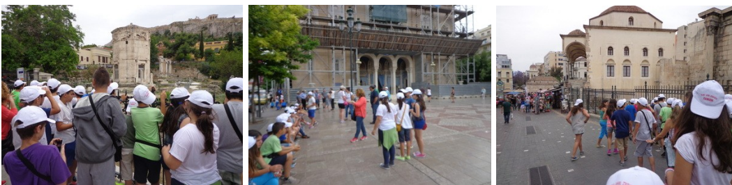
Εικόνα 2: Φωτογραφίες μαθητών από την βιωματική περιήγηση

Στη διαδικασία αξιολόγησης περιλαμβάνεται και η συμμετοχή των μαθητών στη βιωματική επίσκεψη στην Αθήνα, τα σχόλια και οι εντυπώσεις που εξέφρασαν, ο ενθουσιασμός με τον οποίο εντόπισαν τις οδούς και τα μνημεία, με τα οποία είχαν ασχοληθεί και η παρουσίαση των πληροφοριών στους συμμαθητές τους κατά τη διάρκεια της διαδρομής. Εντυπωσιάστηκαν με τα μνημεία που είδαν από κοντά και τόσο καλά είχαν εμπεδώσει τη διαδρομή που, όταν κάποια στιγμή μπερδευτήκαμε στα στενά, τα ίδια τα παιδιά μας βοήθησαν να βρούμε την οδό, έτσι όπως τη θυμόταν από την εικονική περιήγησή τους (Εικόνα 2).