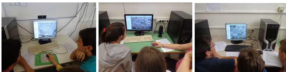
Εικόνα 1: Φωτογραφίες από τις δραστηριότητες των μαθητών στο χώρο του Εργαστηρίου Πληροφορικής

Οι μαθητές δούλεψαν άνετα και ευχάριστα στο χώρο του εργαστηρίου Πληροφορικής του σχολείου μας, ακολούθησαν τις οδηγίες των φύλλων εργασίας και οι παρεμβάσεις έγιναν χωρίς προβλήματα και απρόοπτα. Συνεργάστηκαν όλες οι ομάδες ικανοποιητικά (Εικόνα 1).