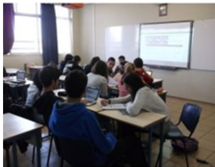
Σχήμα 3: Οι μαθητές εργάζονται ομαδοσυνεργατικά

Το ιδιαίτερο σε όλη τη διαδικασία, είναι πως τα projects είναι δομημένα με ερωτήσεις – δραστηριότητες. Κάθε μαθητής σε κάθε ομάδα, έχει τη δική του ή τις δικές του ερωτήσεις που έχει αναλάβει να απαντήσει, μετά από συνεννόηση με την υπόλοιπη ομάδα. Δίπλα λοιπόν από κάθε project υπάρχουν γραμμικά οι ερωτήσεις του. Στην ίδια στήλη υπάρχει η επιλογή Εργασίες μαθητών όπου ο συντονιστής της κάθε ομάδας, έχει αναλάβει να οργανώσει την ομάδα, αλλά και να αναρτήσει την εργασία σε μορφή MS Powerpoint και την επεξεργαστούν κατάλληλα πριν την τελική υποβολή της. Έχει αναρτηθεί φωτογραφία, ενδεικτική, για τον τρόπο εργασίας στη σχολική αίθουσα (όπως εμφανίζεται στο Σχήμα 3).